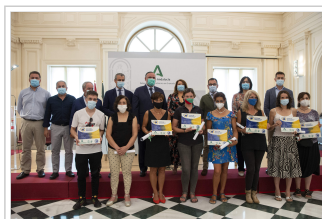
Entrega de las placas y certificados de adhesión a la Carta Europea de Turismo Sostenible a siete empresas del parque

La responsable de Medio Ambiente en Andalucía ha dado la enhorabuena a las entidades que se suman ahora a esta iniciativa y ha anunciado que su Departamento sigue avanzando en este "camino conjunto" impulsando los trámites administrativos de la tercera fase de la implantación de la CETS en la región. En este próximo avance, se podrán sumar a la iniciativa las agencias de intermediación turística, permitiendo así, como ha comentado Carmen Crespo, "tener el círculo más cerrado".