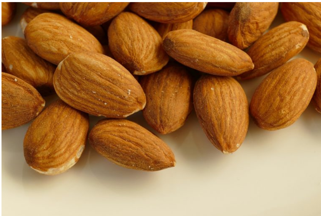
Imagen de Unión de Uniones

Las almendras han vuelto a bajar esta semana en Mercamurcia; los recortes se fueron de entre 1 y 15 céntimos por kilo. La comuna ecológica fue la que registró la mayor caída y se situó en 7,95 euros el kilo. El resto cotizó entre 3,29 de la comuna y 5,05 de la marcona.